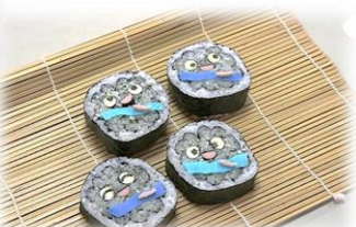
まいやんの飾り巻きずし