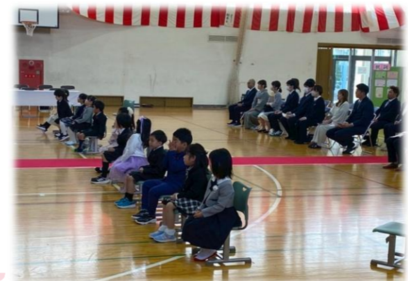
東和小学校入学式

4月8日(水)、東和小学校・東和中学校の入学式が行われ、新一年生が新たな一步を踏み出しました。少し緊張した様子の中にも、これから始まる学校生活への期待にあふれた笑顔が見られ、在校生も進級し、それぞれが新しい目標に向かってスタートを切りました。地域の皆さんで子どもたちの成長を見守っていきましょう。