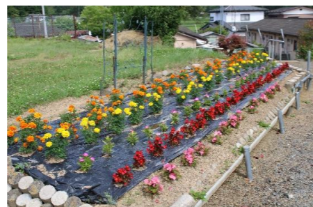
(誤)足柄町協和会 (正)鍛冶町町内会

先月、区長配布で配布しました「米谷地域づくり推進協議会～地域づくり事業報告書～」のP.3「花いっぱい運動」の報告で各自治会の花壇の様子の写真をご紹介しましたが、右のとおり訂正がありました。大変申し訳ありませんでした。お詫びして訂正いたします。