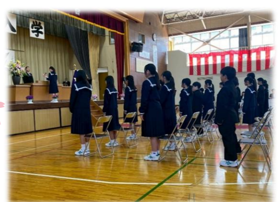
東和中学校入学式