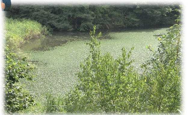
現在の耳取沼周辺

いずれの事業も、詳しくはチラシをご覧ください。米谷公民館までお問い合わせください。