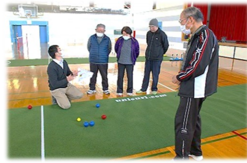
室内ペタンク、奥深いね～