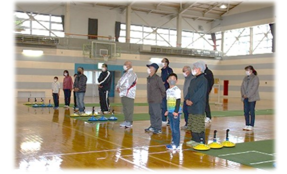
ユニカール大会開会!

1月31日(火)から3週にわたり、令和4年度冬季スポーツ教室を開催しました。今回はマルっと一日、公民館のホールを使って体を動かして頂きました。例年、夜間に開催していた冬季スポーツ教室でしたが、昼間も開催することでより多くの皆さんに参加していただけたと思います。 2月19日(日)には、スポーツ教室でも行っていたユニカールの大会を開催しました。小学生の参加もあり、とても盛り上がった大会となりました。ご参加いただいた皆さん、ありがとうございました。