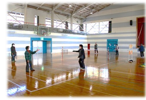
ミニテニスはいい運動になるね～