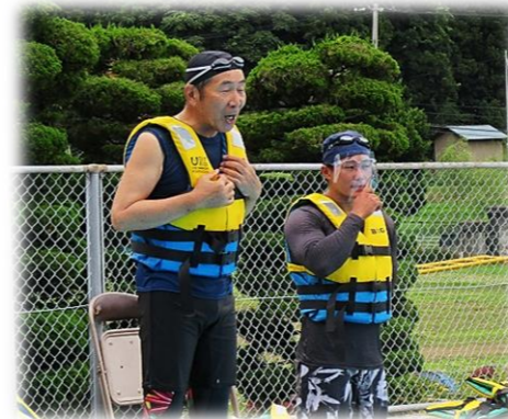
講師の中田海洋センターの職員