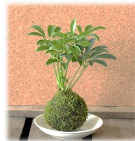
注:イメージ図です