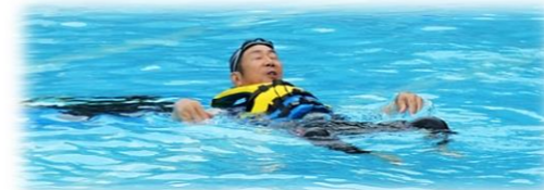
500mlのペットボトルでも大人が浮きます！

7月15日(木)、米谷小学校のプールで「水辺の安全教室」を開催しました。米谷小学校では今年プールが使用できるということで、全児童を対象に中田B&G海洋センターの方に実践的な講義をしていただきました。