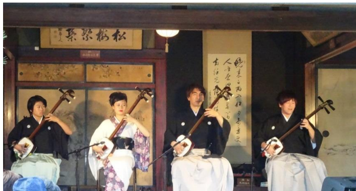
【主催】米谷を楽しむ会・米谷地域づくり推進協議会

当日は、約180名の方々に来場いただきコンサートは大盛況。不老仙館隣のお茶室では、本格的な抹茶が提供され、こちらでもまた、優雅なひとときを楽しみました。