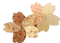
パッチワーク教室